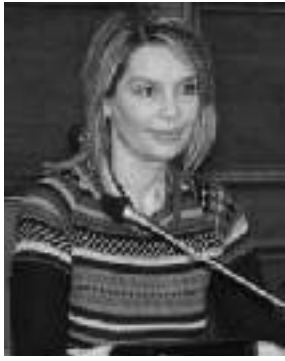
Της Κατερίνας Παπακώστα Βουλευτή Ν.Δ. και Προέδρου της Διακομματικής Επιτροπής της Βουλής για την εξέταση του Σωφρονιστικού Συστήματος

Τις προηγούμενες ημέρες ανακοινώθηκαν από την Κυβέρνηση μια σειρά μέτρων για τη βελτίωση του σωφρονιστικού μας συστήματος.