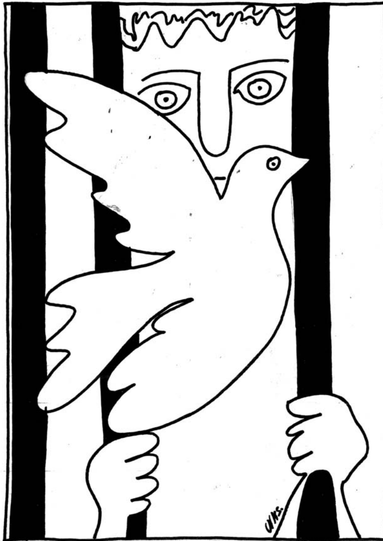
Σκίτσο: Νίκος Χρυσάφης, Σ.Υ. ΕΚΚΝΑ

Συγκεκριμένα, η υπό όρους απόλυση γίνεται για να αποσυμφωρηθούν οι φυλακές. Δεν λειτουργεί στην λογική της επανένταξης. Στη Β. Ιρλανδία λ.χ. λειτουργεί ένα ιδιό-